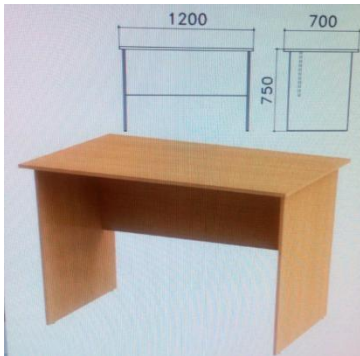
Дополнительный стол 1416 д. х 600 ш. х 757 в., толщина столешницы 16 мм.