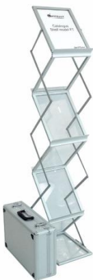
Буклетница напольная 4 кармана