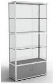
Витрина высокая Размер: 200x50x30 см